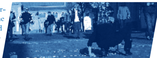
Szenenbild einer Performance

Logotorium. In-sistieren anstatt ex-sistieren. Das alte Spiel der Körper, für die Geste, im Austausch von Zeichen und Stimmen – der offene Prozess atmet – das Gefüge umarmt das Element – in Beziehung tretend – für ein Lied – für einen Raum – für eine Begegnung – für ein Spiel – für eine (Inter)Aktion – für eine Performance – ... – zusammen.