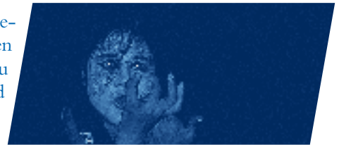
Szene einer Performance

Wo stoßen wir an die Grenzen unserer Ideale? Wo liegen die alltäglichen Herausforderungen im Umgang mit unserer Umwelt? Der Weg zu Erkenntnissen führt über unsere Träume. Wir, Jonglirium, laden ein, die eigene Utopie zu erkunden und mit Leben zu füllen. Wir wollen eine spontane, interaktive und kreative Schnittstelle schaffen, von der aus Diskussionen und Gedanken ins Rollen kommen.