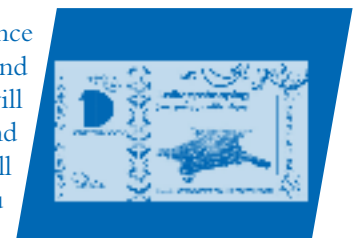
The new money

Join the experiment by artist collective Sociable Science. With this event Sociable Science take on the position of the layman attempting to understand how monetary systems work and underpin everyday life. They will set up a stall named Just Keep Shopping (everything will be okay). The stall will function as a traditional shop, buying/selling goods and services and trading solely in their DIY 'Debloom' currency. The value of this temporary currency will be decided in accordance with their own unorthodox values system. Please call in if you have anything you want to sell and they might be able to cut you a good deal!