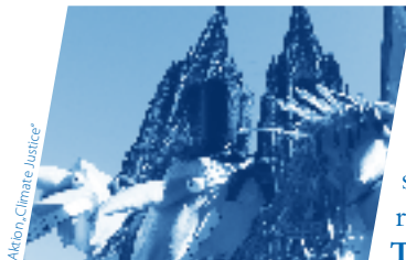
Aktion, Climate Justice*

wir Aktionen, wobei wir nicht nur vor, sondern auch mit den ZuschauerInnen auf der Straße spielen werden. Vorkenntnisse sind nicht nötig, aber Lust am Spielen und Improvisieren. Ein Projekt von GRIPS Werke e.V. in Kooperation mit dem GRIPS Theater. Buchtipp: Theater in Bewegung: Globale Gerechtigkeit spielend vorbringen. ISBN 978-3-00-032631-8