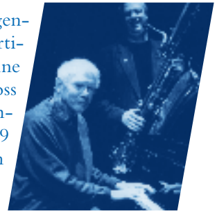
The Trad Jazz Duo