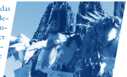
Aktion „Climate Justice“

Die ganze Stadt ist ein Bergwerk, ein Kraftwerk, ein Acker, so lautet das Motto der GRUBE, der Genossenschaftlich Regionalen Grundstoff-Bereitstellung, die heute zu einer informativen Tour durch ihr „Revier“ einlädt und bei der Fahrt unter Tage und zurück ins raue Hier und Jetzt der Oberfläche ihre Antworten auf Peak Oil, Peak Soil, Peak Everything präsentiert. Eine U-Bahnfahrt der anderen Art. www.gerechter-welthandel.de SONNTAG, 13.30 UHR, TREFFPUNKT: TU-HAUPTINGANG. DAUER CA. 90 MINUTEN.