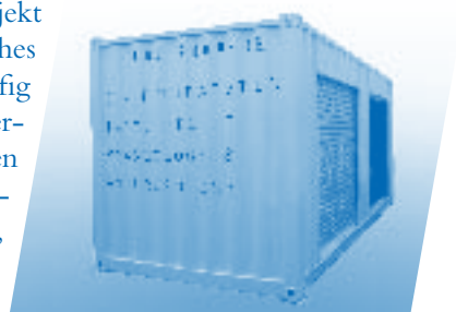
PIPA – Labor, Arbeitsplatz und Ausstellungsraum