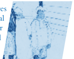
Kids in Winter

DIE LESUNG WIRD IN ENGLISCH UM 9.30 UHR UND UM 11.30 UHR IN DEUTSCH STATTFINDEN.